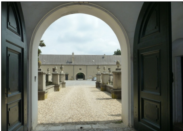
Kulturgut „Schloss Rohrau“ in der Umgebung des Windparks

Die ENERGIEWERKSTATT Consulting GmbH (Munderfing, Oberösterreich), der die Erstellung der kompletten Einreichunterlagen übertragen wurde, hat die REGIOPLAN INGENIEURE mit der Erstellung der Umweltverträglichkeitserklärung (UVE) beauftragt. Die UVE wurde gemeinsam mit dem Büro LAND-PLAN bearbeitet.