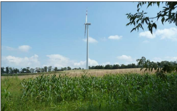
Bestehende WEA in der Umgebung des Projektgebiets

Die ENERGIEWERKSTATT Consulting GmbH (Munderfing, Oberösterreich), der die Erstellung der kompletten Einreichunterlagen übertragen wurde, hat die REGIOPLAN INGENIEURE mit der Erstellung der Umweltverträglichkeitserklärung (UVE) beauftragt. Die UVE wurde gemeinsam mit dem Büro LAND-PLAN bearbeitet.