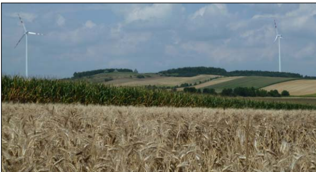
Bestehende WEAs in der Umgebung des Projektgebiets

Die ENERGIEWERKSTATT Consulting GmbH (Munderfing, Oberösterreich), der die Erstellung der kompletten Einreichunterlagen übertragen wurde, hat die REGIOPLAN INGENIEURE mit der Erstellung der Umweltverträglichkeitserklärung (UVE) beauftragt. Die UVE wurde gemeinsam mit dem Büro LAND-PLAN bearbeitet.