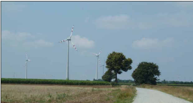
Bestehende WEAs: Alte Ungarnstraße im Projektgebiet

Die ENERGIEWERKSTATT Consulting GmbH (Munderfing, Oberösterreich), der die Erstellung der kompletten Einreichunterlagen übertragen wurde, hat die REGIOPLAN INGENIEURE mit der Erstellung der Umweltverträglichkeitserklärung (UVE) beauftragt. Die UVE wurde gemeinsam mit dem Büro LAND-PLAN bearbeitet.